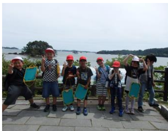
最後は、福浦島から見える景色をバックに記念撮影♪