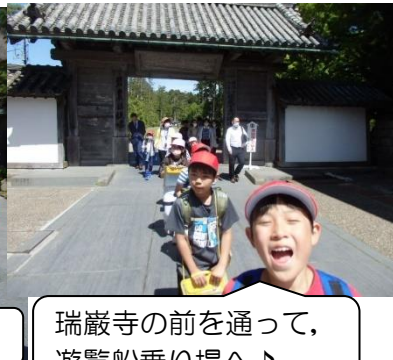
瑞巖寺の前を通過って、遊覧船乗り場へ♪