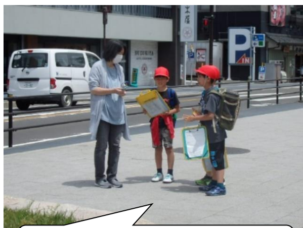
班ごとに五大堂付近を散策。お店の方や観光客にインタビューしました。