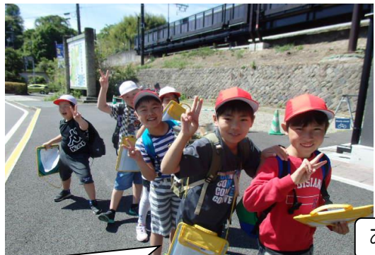
松島海岸駅からスタートです！

社会科の学習の一環として「松島海岸」で校外学習を実施した。3年生の社会科では「市の様子」について学習している。自分たちが住んでいる「松島町」について、位置や地形、交通、産業、古くから残る建造物など、様々な面から学ぶことをねらいとしている。松島海岸での校外学習を通して、学校周辺との違いに気付き、松島町の様子は場所によって違いがあることを感じる事ができた。