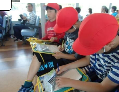
学んだことをたくさんメモしていました！えらい！