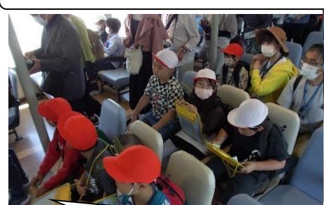
出航！アナウンスを真剣に聞いて島を探していました。