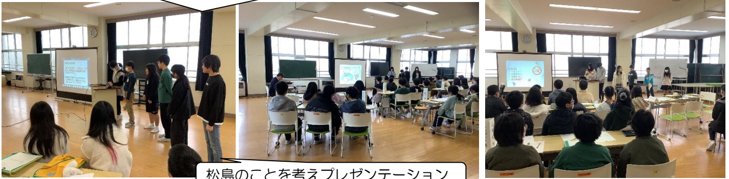
松島のことを考えプレゼンテーション