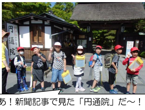
あ！新聞記事で見た「円通院」だ～！