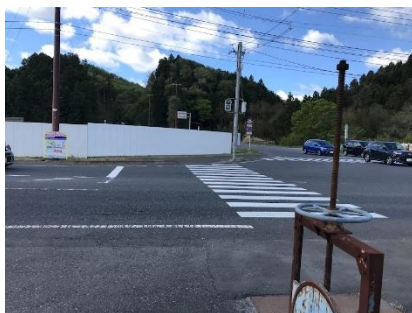
歩道橋工事に伴った通学路変更で使用するようになった横断歩道。 小森トンネル方面からの右折車が時々スピードを出している。