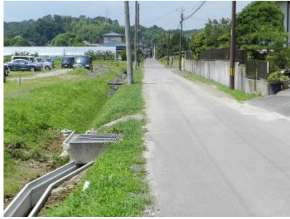
学校前歩道橋を渡り、反町方向への通学路水路が降雨で増水し、フェンスがない。