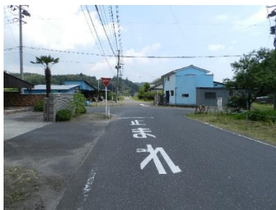
初原 大郷～松島線の抜け道 朝、通り抜ける通勤車が多い。