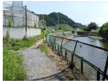
愛宕 J Rガード付近の通学路 道幅狭く、田中川のフェンス傾きあり。