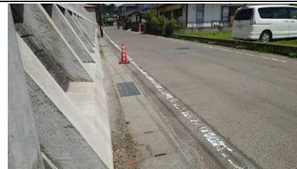
セザールマンション階段下 「駐車禁止」のカラーコーン表示あり。 歩道は狭い。