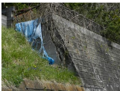
中村団地下の住宅 土台部分が地震等で損壊。雨水が染み出している。